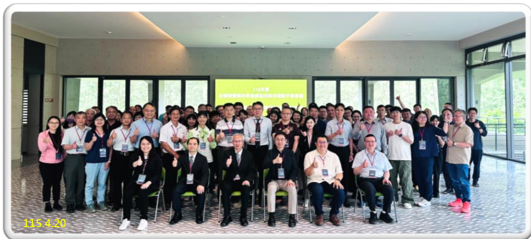
「115 年度檢警調林移查緝盜伐森林聯繫平台會議」

本署表示，國土犯罪不僅侵害國家安全，更破壞環境生態平衡。未來將持續依「檢察機關查緝國土保育及環保犯罪行動方案」，結合跨部會力量，精進科技執法及不法所得查扣機制，深化平台協作，強化整體查緝效能，堅定打擊盜伐森林犯罪之決心，共同守護臺灣青山綠水，邁向永續發展之目標。