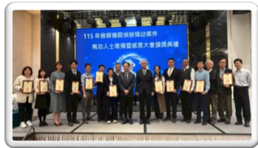
與會長官與有功人士之合照