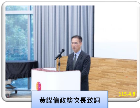
黃謀信政務次長致詞

法務部黃謀信政務次長表示：法務部作為懲詐主責機關，除了追緝詐欺犯罪，更重視「被害人保護」，打詐新四法之修訂，強化追訴，並側重協助被害人追回款項及事先預防。本次臺高檢署與上海商銀簽署合作意向書之核心價值在於：建立預防機制，透過金融機構與檢察機關的合作，主動發掘潛在被害人，甚至在民眾尚未察覺被騙前，藉由行政措施與公私協作即時攔阻。本次打詐合作，彰顯團隊合作價值、肯定金融機構成效、鼓勵打詐國家隊士氣，共同守護民眾財產。