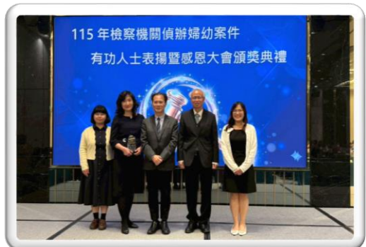
與會長官與有功人士之合照