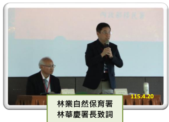
林業自然保育署 林華慶署長致詞

的目標，並非單一部門可以獨力完成，而是一項需要跨域整合、長期投入的工作，林業自然保育署也將秉持「防」「治」兼顧的方向，與所有平台成員機關攜手努力。