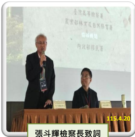
張斗輝檢察長致詞

為維護國土永續發展，有效打擊盜伐森林不法行為，彰顯政府守護國土保育及環境公益之決心，本署、農業部林業及自然保育署（下稱林業自然保育署）於 4 月 20 日共同舉辦「115 年度檢警調林移查緝盜伐森林聯繫平台會議」，會議由本署張斗輝檢察長、林業自然保育署林華慶署長共同主持，並由本署、林業自然保育署、內政部警政署、內政部移民署進行盜伐森林業務報告。