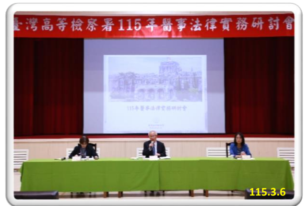
115年醫事法律實務研討會綜合座談

本次研討會邀請法務部鄭銘謙部長、衛生福利部長官及本署張檢察長蒞會致詞，並邀集檢察機關、醫界、法界及主管機關之醫師、法官、檢察官與專家學者擔任各主題講座。