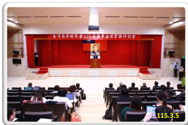
「115年醫事法律實務研討會」

透過本次研討會促進醫法領域之交流與對話，凝聚各界專業意見，期能強化檢察機關辦理醫療爭議案件之專業能力與實務運作，並進一步完善醫療爭議處理與調解機制，促進醫病關係和諧，提升整體醫療與司法體系之運作效能。