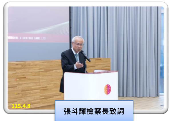
張斗輝檢察長致詞

本署張斗輝檢察長表示：為落實打詐綱領 2.0「嚴懲詐團、減少詐欺發生數及降低財損數」目標，除持續規劃對高風險詐欺案件類型查緝外，並強化跨機關及公私協力合作，經本署統計人頭帳戶新收案件數，已呈下降趨勢，但詐騙、洗錢集團為詐取不法利益，透過科技、網路、新興金融服務、虛擬資產、人頭公司等方式，進行詐騙、洗錢。本署業已邀集相關行政主管機關及懲詐團隊，研議相關資訊分享及加強查緝，俾以建立金融安全防範洗錢機制，以抑制詐欺、洗錢犯罪。