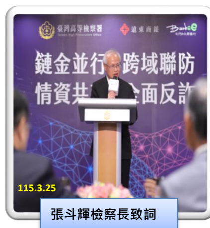
張斗輝檢察長致詞

本署張斗輝檢察長表示：為落實打詐綱領 2.0「減少詐欺發生數及降低財損數」目標，除持續規劃對高風險詐欺案件類型查緝外，並強化跨機關及公私協力合作，經本署統計人頭帳戶新收案件數，已呈下降趨勢，但詐騙、洗錢集團為詐取不法利益，透過科技、網路、新興金融服務、虛擬資產、人頭公司等方式，進行詐騙、洗錢。本署業已邀集相關主管及執法機關，研議資訊分享及加強查緝，俾以建立金融安全防範洗錢機制；遠東銀行是國內最大虛擬貨幣金流樞紐，與多家提供虛擬資產服務業者合作，透過其所建置之金流管理及異常偵測合作機制，對於透過虛擬資產所為詐欺、洗錢犯行之預警及攔阻，有很大助益。