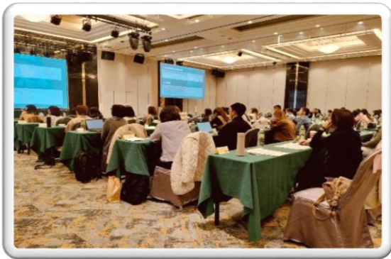
115 年檢察機關偵辦婦幼案件研習會

本次研習會規劃多項專業課程，包含有施用毒品懷孕婦女及其幼兒之案件偵辦或轉介，並邀請 115 年度獲得檢察機關偵辦婦幼案件有功人士擔任各場次課程之講師，分享其偵辦婦幼案件過程之重要寶貴經驗，此外，也藉由各類案件偵辦之經驗分享並同時帶入跨機關之網絡協作模式等主題。期待透過深度的經驗交流與專