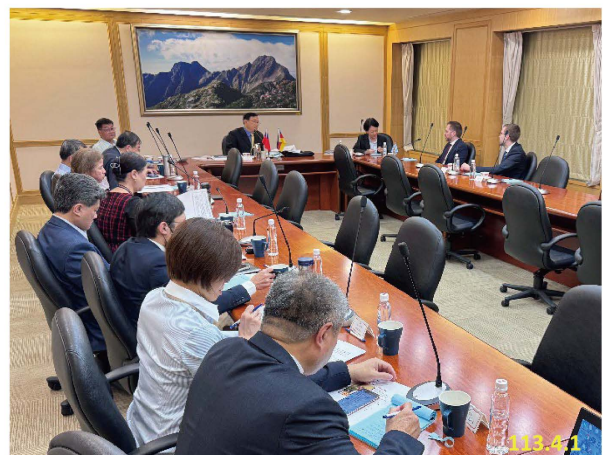
最高檢察署與德國班堡高檢&地檢署檢察官實務座談