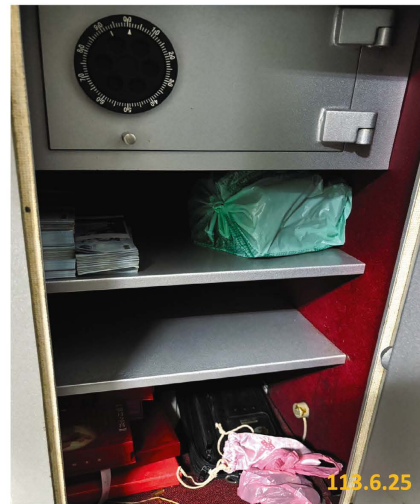
雲林地檢指揮偵辦麥寮鄉前蔡姓鄉長等 涉嫌藉勢藉端勒索綠能廠商案

四、邢總長表示：「切實查緝綠能貪瀆案件，定期同步掃蕩、溯本清源，讓不肖公務員、民代不敢收，廠商不敢送」。最高檢察署並呼籲，涉犯綠能貪瀆不法之行賄廠商如勇於自首，儘速檢舉不法官員，檢察機關將依證人保護法（污點證人）之相關規定做好身分保密，並減輕或免除其刑；已收賄之公務員及民代如儘速自首，或轉任污點證人，可減輕或免除其刑。