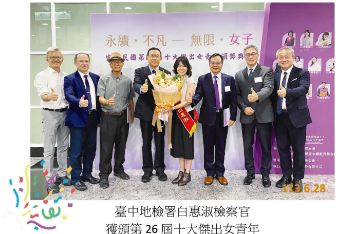
臺中地檢署白惠淑檢察官 獲頒第 26 屆十大傑出女青年

神，關心公共事務，捍衛公共利益與人權，全體檢察官引以為榮，事實上白檢察官的努力，也是全國檢察官的縮影，我們也對全國辛苦的檢察官同仁致以最高的敬意」。