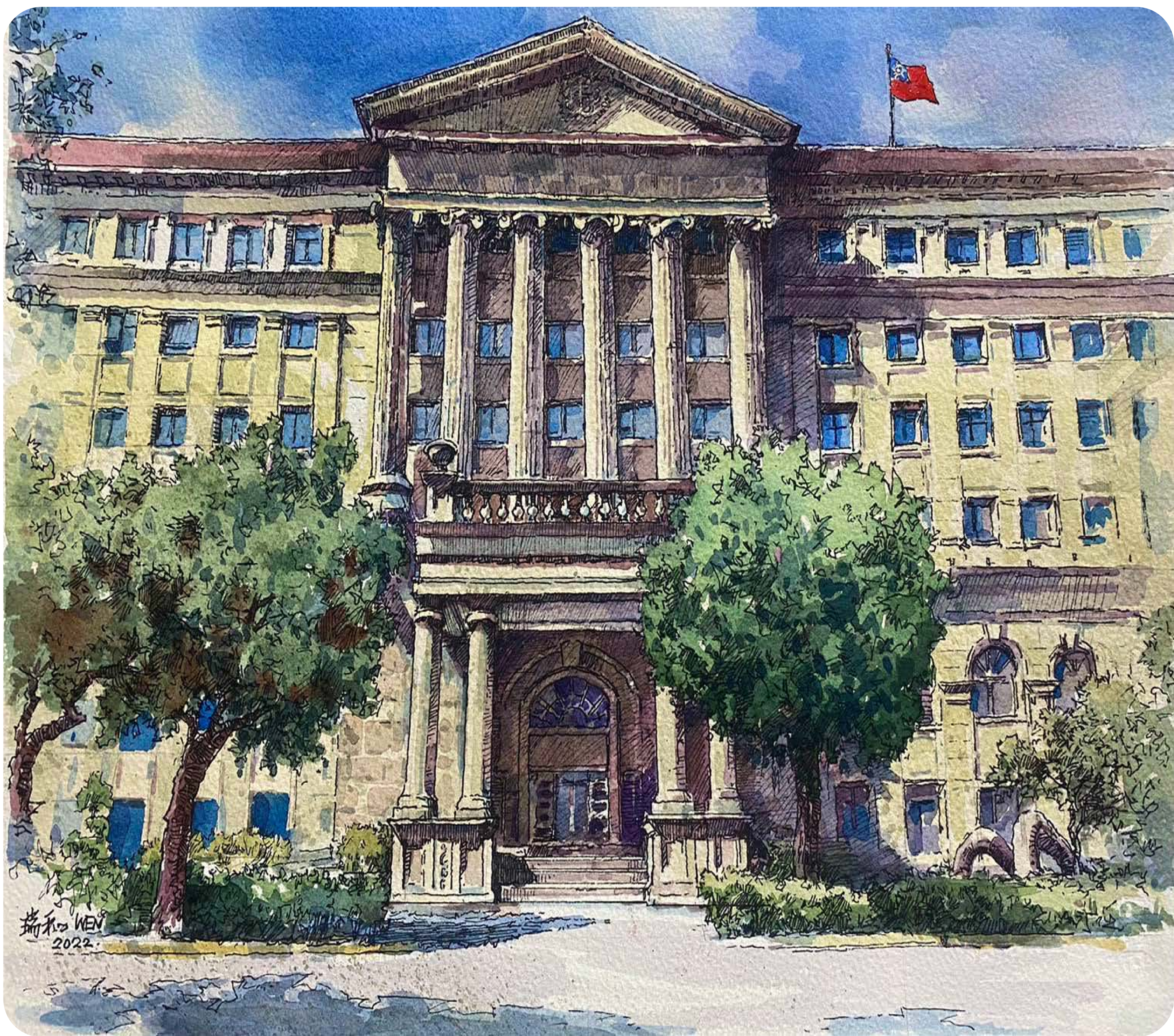
2022 / 最高檢察署

綜前所述，可知目前國內當選無效判決已從候選人本人之行為拓展至親友、甚至是競選團隊人員之行為，對於打擊賄選、端正選風，自有正面之意義，也表示國人對於反對賄選之意識正在抬頭，這正是邁向政治上自主成熟之象徵。若能參考前開他國之立法例，將我國法規不足之處加以補強，當能肅清賄選、端正選風，更符合國人之期待。