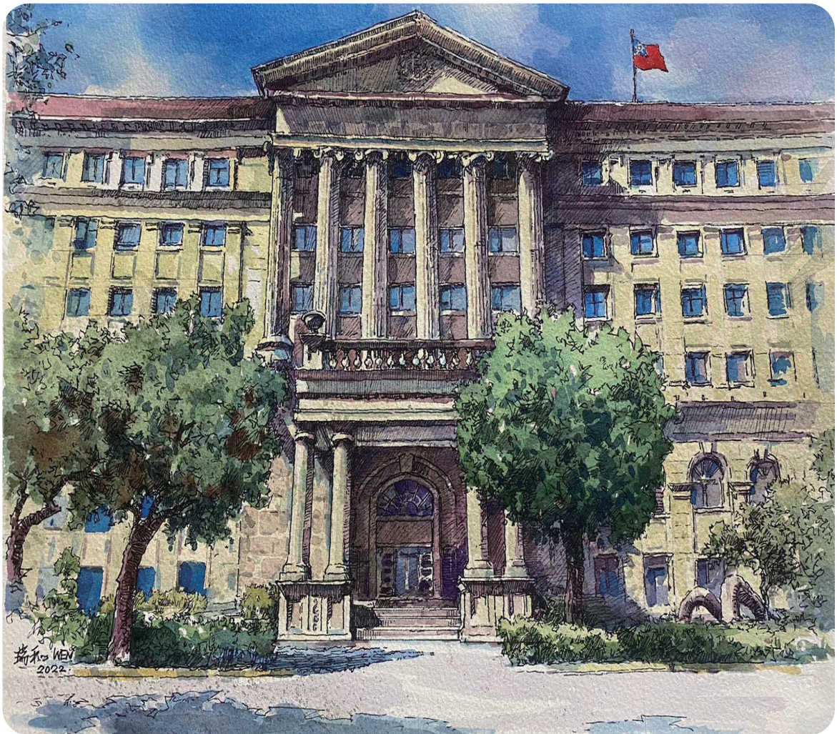
2022 / 最高檢察署

綜前所述，可知目前國內當選無效判決已從候選人本人之行為拓展至親友、甚至是競選團隊人員之行為，對於打擊賄選、端正選風，自有正面之意義，也表示國人對於反對賄選之意識正在抬頭，這正是邁向政治上自主成熟之象徵。若能參考前開他國之立法例，將我國法規不足之處加以補強，當能肅清賄選、端正選風，更符合國人之期待。