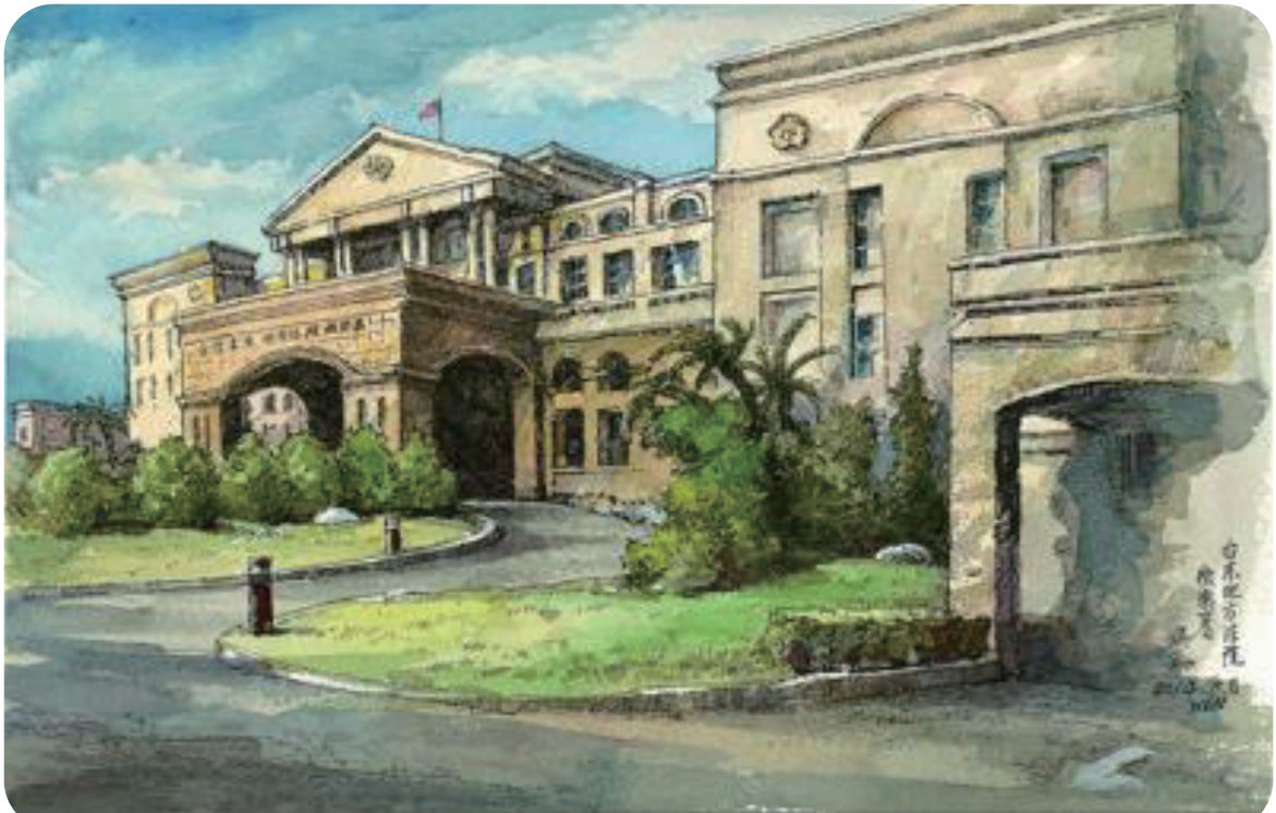
2014 / 臺東地檢署

因此，在偵辦賄選案件時，最好以團隊協同辦案方式為之，不僅可在搜索或訊問時予以分工合作，事先更可以討論案情，甚至在偵辦時排除內外壓力，但最重要的，仍是希望提升民眾之道德觀，讓民眾瞭解到賄選之惡害，全民拒絕賄選，才是國家社會之福。