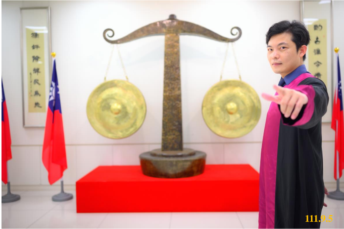
全國北中南檢察官積極投入查賄