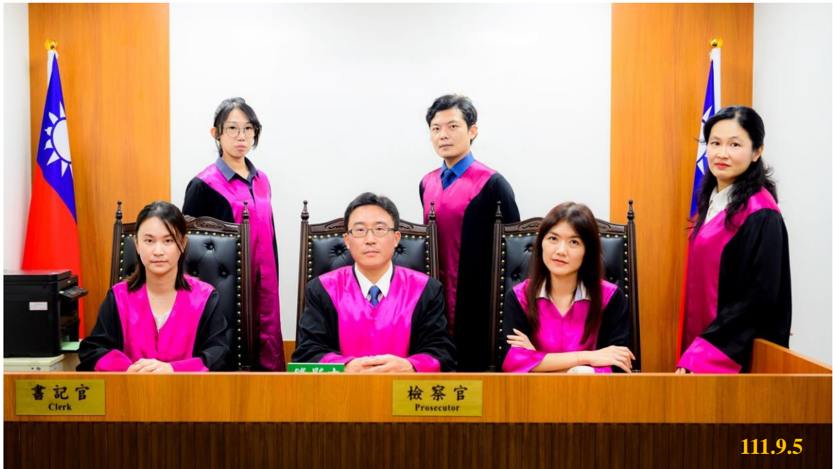
全國北中南檢察官積極投入查賄