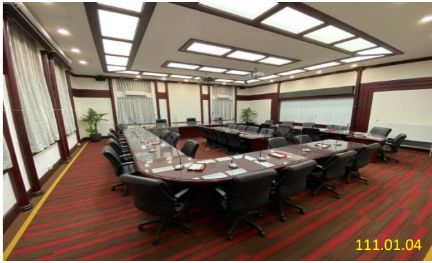
本署整修後第一會議室（原簡報室）