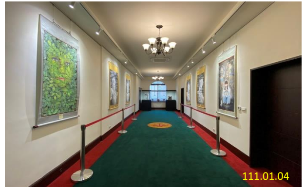
本署創設之文化藝廊