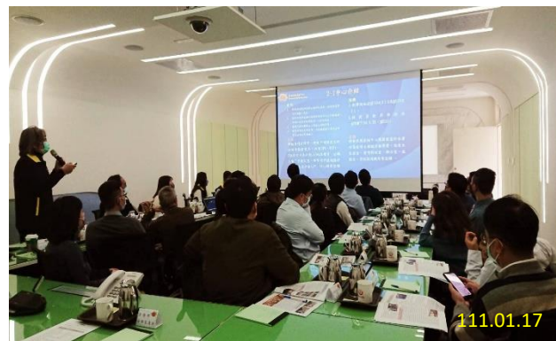
科技監控教育訓練-檢察官種子班

未來，期待藉由科技設備監控中心之建置，可以推展相關技術至犯罪偵查、被害人保護及刑事執行等各項領域，以節省司法資源，達到科技偵查與精準執法，兼顧社會公義與人權保障。