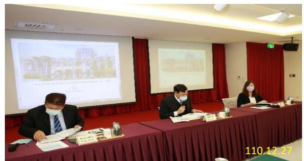
會議綜合座談現場

藉由此次會議，集中檢警力量，並能運用「打擊不法犯罪協調聯繫平台」隨時聯繫、解決問題，針對指標性案件強力掃蕩，讓民眾看見檢警的決心。