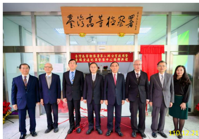
查緝資通犯罪督導中心揭牌典禮合照

資通犯罪因具隱匿性、智慧性及跨境性，已然成為我國當前最猖獗、隱晦及暴利之犯罪型態。為因應資通犯罪查緝之困難，並發展策略以打擊現行及未來可能產生的資通犯罪，本署特別成立「查緝資