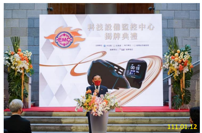
法務部蔡部長清祥致詞