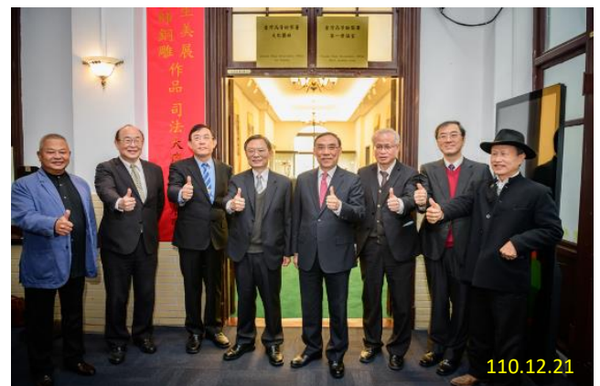
文化藝廊揭牌典禮合照

鑒於本署第一辦公室(舊司法大廈內)簡報室空間設計不敷所需，且設備老舊，無法因應視訊會議所需，乃重新規畫設計，修繕工程以流暢會議空間及動線、明亮、美觀及實用為主，結合數位科技，打造符合現代科技需求之完善會議處所