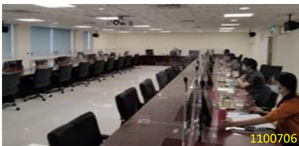
區域聯防科技緝毒實務視訊教育訓練

(二) 整合緝毒單位資源，解決快遞、郵包毒品案件遽增之困境：(1) 110 年 6 月 22 日、7 月 12 日本署與法務部調查局毒品防制處共同研議整合緝毒單位資源、精進查緝毒郵包案件等可行方案。(2) 110 年 7 月 6 日上午，邀請關務署及調查局講座，以視訊方式舉辦毒郵包及快遞貨物查緝之教育訓練，邀請檢察機關及各緝毒單位研討現況、面臨困境及因應作為。(3) 110 年 7 月 7 日上午由本署涂主任檢察官