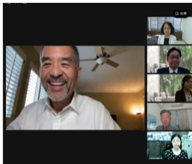
臺美視訊會議畫面

能力，使用視訊訊問在法制面亦無問題，惟仍應注意取證程序合法正當及被告權益保障，以免證據能力受質疑。