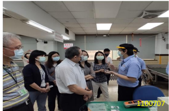
本署訪視關務署臺北關

率同本署檢察官、檢事官前往關務署臺北關松山分關，瞭解利用緝毒犬隊、X 光影像判讀查緝郵包情形，並就因應毒郵包案件遽增之未來精進模式進行意見交換。