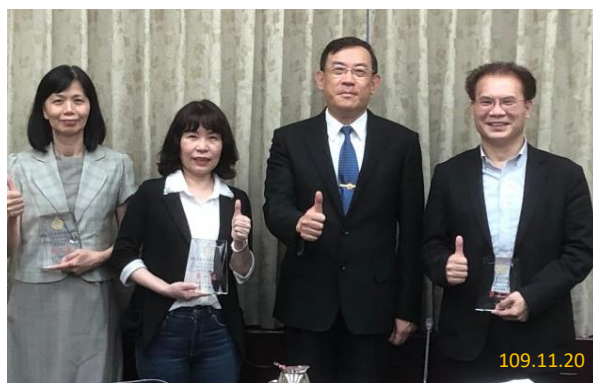
刑檢察長頒獎表揚前 3 名地方檢察署

本專案稽核經濟效益（保障人民財產及增加國庫收益）達新臺幣 1 億 2,973 萬 9,635 元，且各地方檢察署逾十年以上未處理刑事保證金已大幅減少。效益顯現主因在於機關首長認同及同仁投入，本署刑檢察長亦公開頒獎表揚總體效益前 3 名之臺灣臺北、新竹及屏東地方檢察署。