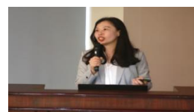
臺灣高等檢察署檢察官分享辦案心得