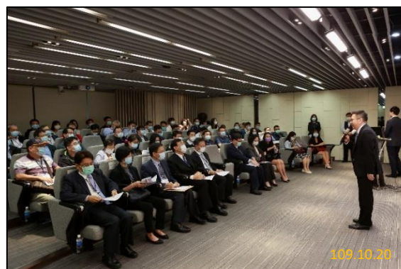
(攝於臺灣集中保管結算所)