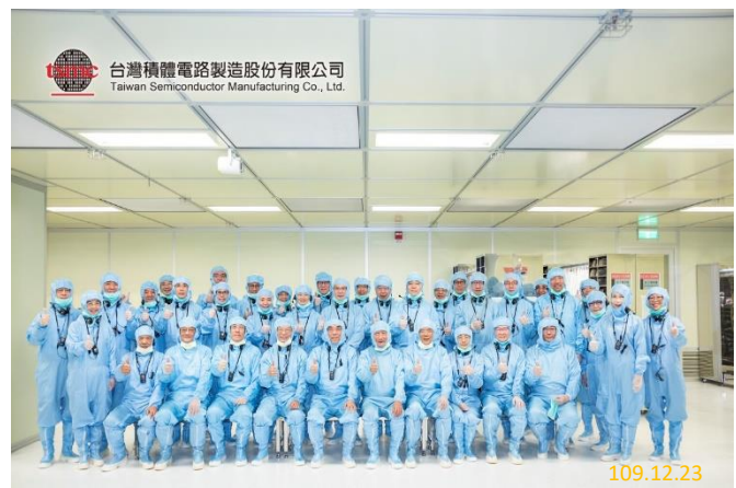
參觀晶圓製造無塵室

本署於109年12月21至23日邀集全國一、二審檢察署檢察長，假臺中地區舉辦109年度第2次檢察長業務座談會。本次會議特別安排參訪漢翔航空工業、台灣積體電路製造股份有限公司及臺中清泉崗空軍基地，使與會人員瞭解國機國造之航太暨國防工業、民間科技產業之發展現況及營業秘密保護機制對產業競爭力領先之重要性，透過此次交流，促成產業界與司法界間之溝通聯繫，提升檢察官專業與辦案效能。