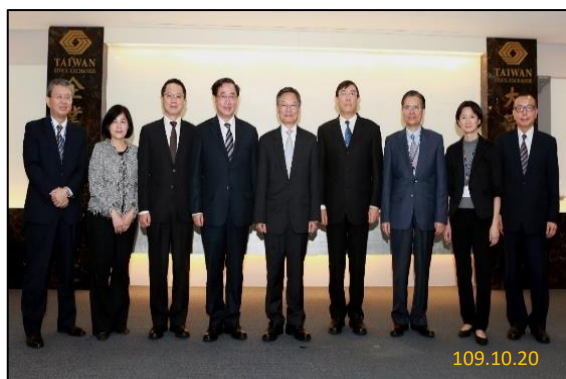
(攝於臺灣證券交易所)

連、股票交易制度變革及監視制度等內容，亦實地參訪集中保管結算所股票博物館及證券交易所股票監視室，行程豐富，期能提升與會主任檢察官偵辦是類案件之專業知能，強化金融犯罪之查緝能量。