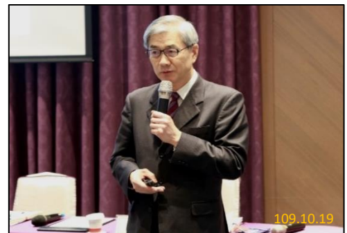
金融監督管理委員會黃天牧主委 講授金融監理新趨勢