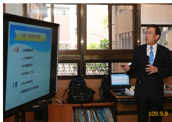
邢檢察長介紹本署四大重點工作

本署邢檢察長並就臺高檢署近半年檢察業務重要措施及成效進行簡報，提高政策走向能見度。現階段除著眼於人力調整、業務精簡、減少再議案件發回及建立移轉管轄一致標準外，並明確列出四項重點工作。