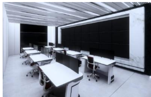
科技監控中心設計圖 預計2020年12月完成環境建置/ 2021年5月完成新系統建置