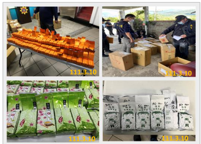
臺東地檢署查獲疑似混充茶葉