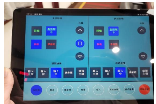
視訊會議環境控制面板

本署原先舉辦視訊會議時，都由本室負責架設相關軟硬體及協助操作，需耗費大量的事前準備時間與人力，有鑑於此，特別規劃一間視訊會議專用會議室，配有能與視訊會議軟體搭配的鏡頭、麥克風等設施以及方便操控的環控系統，簡單易用的功能讓使用者能快速召開或參與視訊會議，節省大量事前準備作業。近年則因新冠肺炎疫情爆發，視訊會議使用率激增，原有專用會議室不敷使用，爰本室針對本署所有的會議室都重新規劃建置視訊會議設施，讓視訊會議設備成為本署會議室的標準配備。