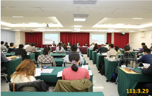
查緝資通犯罪實務研習會雙向交流座談

任講師，以使檢察官在偵辦資通犯罪案件時能有所助益。再資通犯罪之查緝，非僅能由檢察機關獨撐大局，仍需結合其他公務機關及業界之力量，所以本次研習也邀請民間業者，講授如何協助偵查及犯罪預防，及介紹區塊鏈存證應用，希望透過此次授課，作為橋樑，跨界尋找合作查緝資通犯罪的可