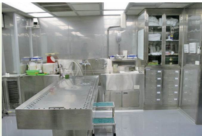
臺南市解剖中心 / 臺南地檢署

二、為使相驗解剖中心在執行業務過程中，讓往生者有尊嚴，讓家屬感受到照顧，避免執行業務同仁遭病毒污染，爰與臺南市政府合作，在臺南市殯葬管理所內設置全國最接近世界衛生組織標準的「法醫相驗解剖中心」，於 98 年 5 月 12 日落成啟用。