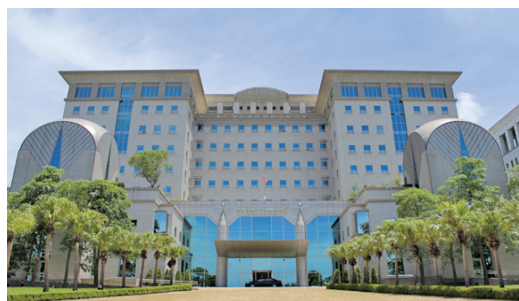
臺南地檢署現址辦公大樓 / 臺南地檢署

83年間因人員、業務迅速增加，致辦公空間不敷使用，經向上級爭取覓地規劃新建辦公大樓，88年陸續完工，89年完成驗收啟用，即目前使用之辦公廳舍。