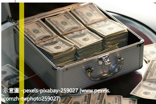
示意圖 - pexels-pixabay-259027 (www.pexels.comzh-twphoto259027)

臺南地檢署檢察官以 89 年度偵字第 9809、11500 號對廖○本及李○德提起公訴，江○駿則另行通緝。李○德部分，歷經三審，終以有期徒刑 2 年定讞。廖○本部分，