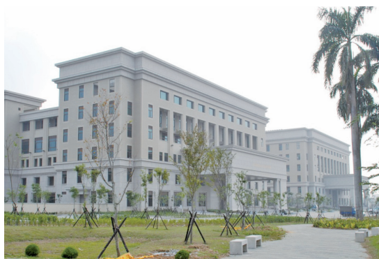
嘉義地檢署新辦公大樓外觀 / 嘉義地檢署

嘉義院檢新建辦公大樓，於81年10月核准興建，幾經波折，於93年8月完成發包，同年9月21日院檢聯合開工動土，96年9月11日完工啟用。