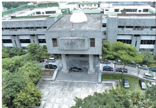
78 年院成立時院檢大樓正門