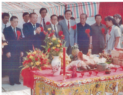
77年7月13日上午10時，臺灣高等法院高雄分院暨同院檢察處聯合辦公大樓奠基動土大典 / 高雄高分檢署

辦公廳舍係於79年5月2日建造完工，與臺灣高等法院高雄分院合署辦公，建物座落於高雄市鼓山區龍華段二小段1758地號，土地與建物為院方持三分之二、檢方持三分之一，共同經營。位處北高雄精華地段，週邊環境機能充足。