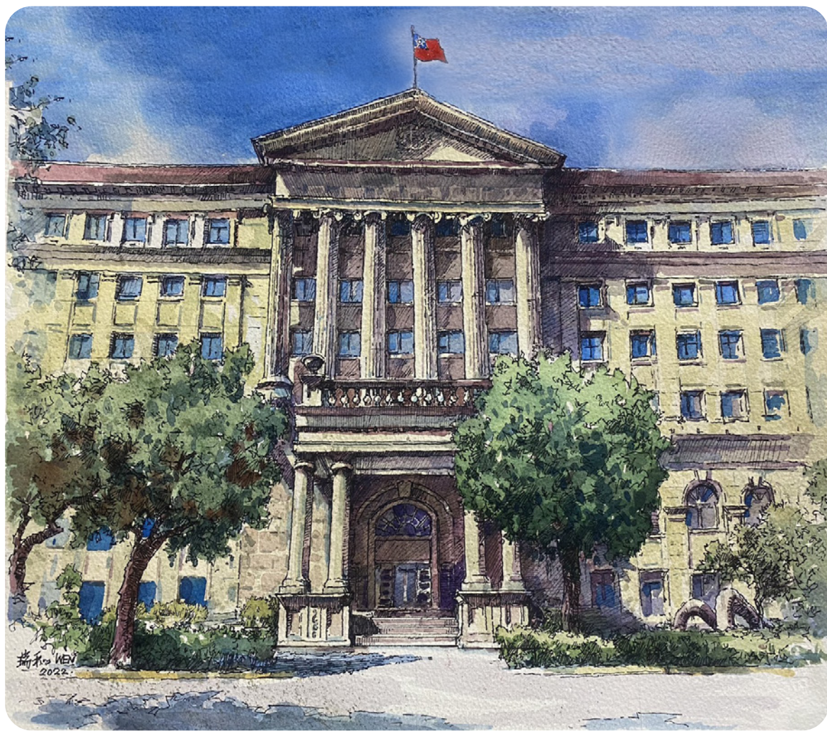
2022 / 最高檢察署

綜前所述，可知目前國內當選無效判決已從候選人本人之行為拓展至親友、甚至是競選團隊人員之行為，對於打擊賄選、端正選風，自有正面之意義，也表示國人對於反對賄選之意識正在抬頭，這正是邁向政治上自主成熟之象徵。若能參考前開他國之立法例，將我國法規不足之處加以補強，當能肅清賄選、端正選風，更符合國人之期待。