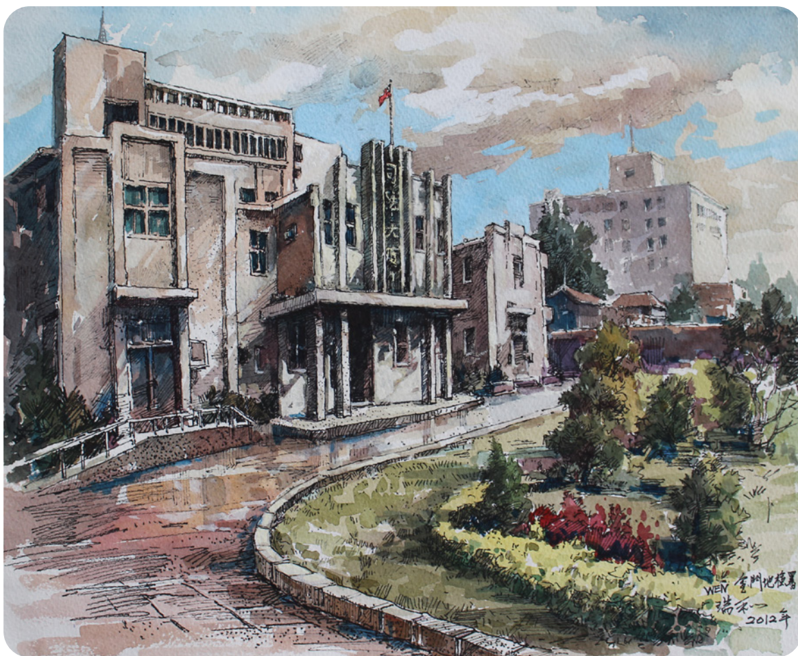
2012 / 金門地檢署

建請法務部透過兩岸司法互助協議機制，協調大陸公檢司法部門，同意我方指派司法人員赴大陸地區進行查察賄選等犯罪偵查工作，並設置對口連繫單位，接受我方司法機關之委託，協助調閱犯罪嫌疑人在大陸之往來銀行帳戶資料等等相關偵查作為。