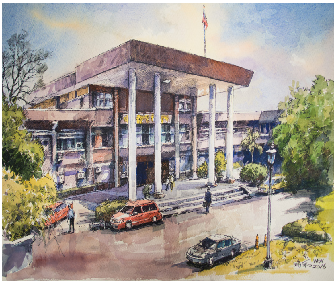
2016 / 彰化地檢署

理污點證人之被告時，儘量給予免刑或緩刑之宣告，使重大案件在偵審，給予共犯誘因，偵查中轉為污點證人，審判中供出實情，以突破案情之關鍵(參照法務部 97.6.17 法檢字第 0970020800 號函暨檢附之「法院對於轉為污點證人之被告未依檢察官請求判決免刑或緩刑之改進措施」)。